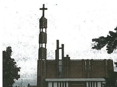
Montage fourni par Rogers montrant la tour de transmission adjacente à l'église.

Le prêtre était aussi présent et il affirmait qu'il n'y a aucun danger et que l'environnement sera respecté. Évidemment,